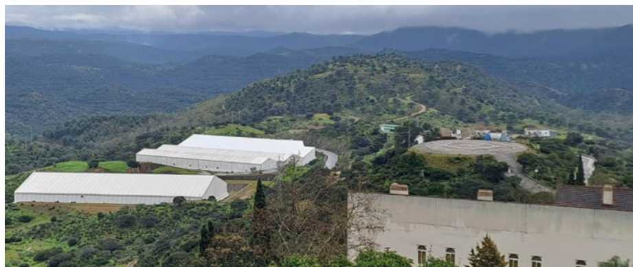
Al fondo, detrás del helipuerto, cerro de Los Pavillos, donde se construirá la plataforma sureste

Las celdas se dispondrán en 3 filas de 9 celdas cada una, de modo que la plataforma sureste contará con 3 techados móviles con sus correspondientes puentes grúa, lo que, indica Gallego, “dará mayor versatilidad a la instalación para la gestión de las unidades de almacenamiento en celdas”. Por otro lado, explica la responsable del Departamento de Ingeniería de RBMA de Enresa, “las celdas serán superficiales, a diferencia de las actuales, de manera que la cara superior de la losa de cimentación estará enrasada con la cota de operación de la plataforma, lo que permitirá el eventual acceso a su interior”.