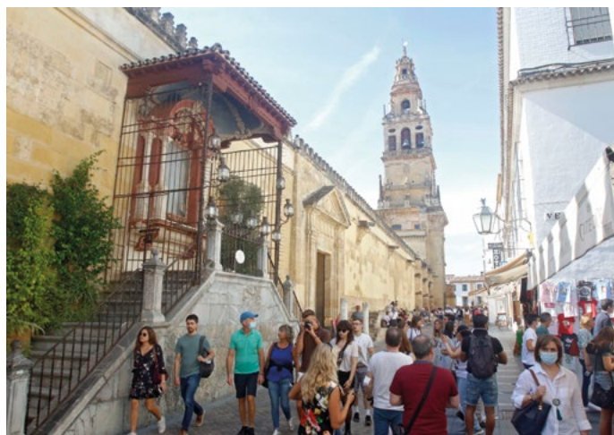
Exterior de la Mezquita

“Sería conveniente que mantengamos el Centro Histórico como un Centro vivo, donde haya barrios y no suceda como en la zona del entorno de la Mezquita-Catedral, donde prácticamente todo son viviendas turísticas, apartamentos turísticos u hoteles”, destaca. De Gracia insiste en que el segundo reto es el de atraer al Centro Histórico a población joven e inversiones no hosteleras que permitan recuperarlo “en aquellas partes en las que es necesario”.