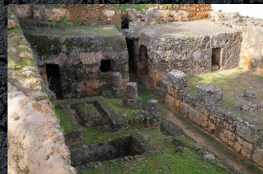
Tumba del Elefante. Carmona

Como aspectos destacables, resaltar el carácter monumental de determinados edificios, como la Tumba del Elefante o la Tumba de Servilia; la presencia de espectaculares ajuares funerarios, que pueden ser apreciados en el Museo del propio conjunto, así como un paisaje de gran personalidad donde se sitúa éste.