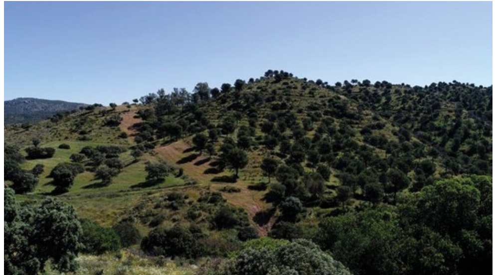
Cerro de Los Pavillos, donde se ubicará la plataforma

El Pleno del Consejo de Seguridad Nuclear ya informó favorablemente en diciembre la solicitud de autorización de ejecución y montaje de estas nuevas estructuras de almacenamiento y, en febrero de 2024, la Dirección General de Calidad y Evaluación Ambiental del Ministerio para la Transición Ecológica y el Reto Demográfico (MITECO) emitió la Declaración de Impacto Ambiental del proyecto para la construcción de esta infraestructura.