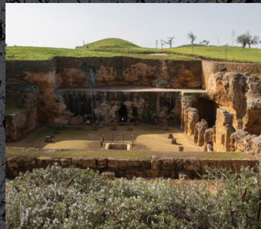
Tumba de Servilia. Carmona

En época romana, Carmona disponía de cuatro puertas que permitían la comunicación de la ciudad amurallada con el exterior. De ellas sólo permanecen dos: la Puerta de Sevilla y la Puerta de Córdoba. Aún hoy permanece, casi sin cambios, este trazado que permite el acceso a la ciudad por ambas puertas y su interconexión