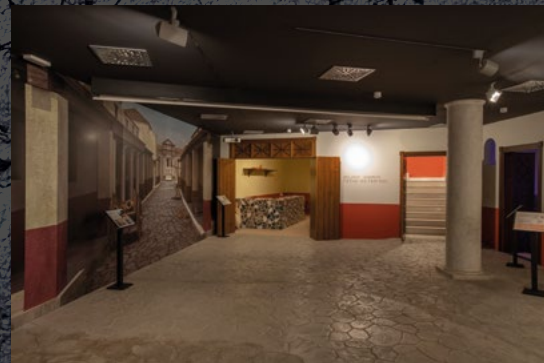
CENTRO DE INTERPRETACIÓN COTIDIANA VITAE El Centro Temático "Cotidiana Vitae" de Santiponce recrea diversos espacios de la ciudad romana de Itálica, y permite realizar un viaje en el tiempo para conocer las singulares vida y costumbres del Imperio Romano, desde la reconstrucción de una calle, entrando en una taberna y unas termas, a una casa romana, pudiendo visitar sus diferentes habitaciones: la cocina, el dormitorio, el "triclinium" (comedor)

El itinerario principal propuesto discurre por el barrio construido por Adriano en el primer tercio del siglo II d.C., protegido a raíz de su excavación y de la creación de un parque moderno que ha contribuido a una mejora paisajística considerable. No obstante, el área visitable del Conjunto Arqueológico recorre también una parte situada en el casco urbano de Santiponce, que incluye el Teatro y las Termas Menores, testigos de la ciudad preadrianea conservada bajo este municipio.