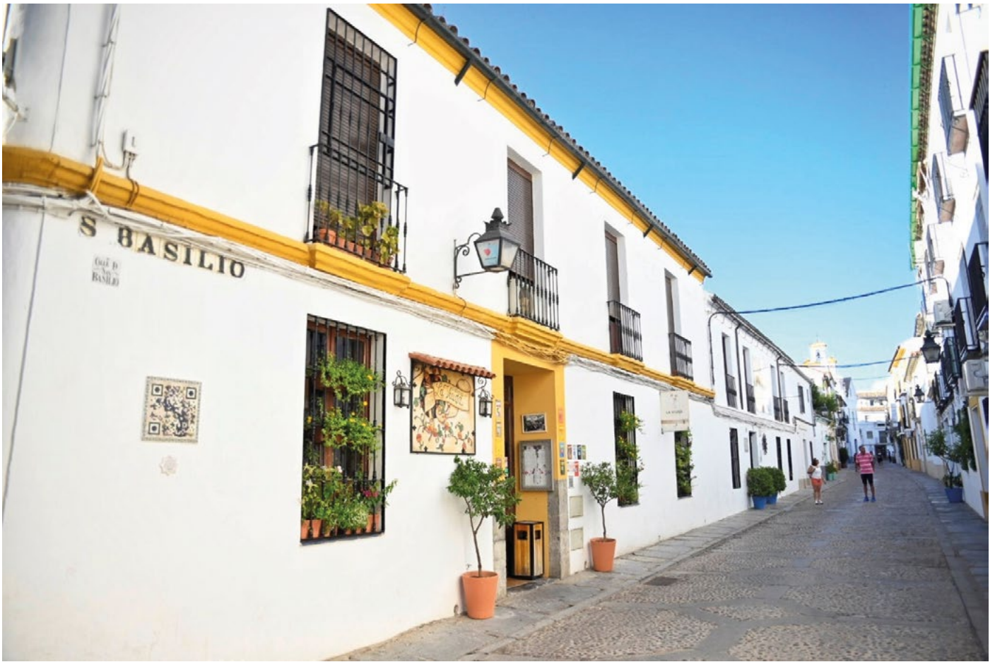
Calle San Basilio, en el barrio de Alcázar Viejo

EN 1972, LA UNESCO DEFINIÓ LA CALIFICACIÓN DE PATRIMONIO DE LA HUMANIDAD como “un bien cultural o natural que debe ser protegido por su interés extraordinario para toda la humanidad”. En el caso de Córdoba, la Unesco otorgó ese sello primero a la Mezquita-Catedral el 9 de mayo de 1984 y 10 años después, en diciembre de 1994, amplió la declaración a todo el Centro Histórico definido en aquella fecha.