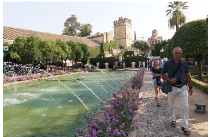
Alcázar de los Reyes Cristianos

“ El plan parte de la identificación de una serie de invariantes que caracterizan las cualidades urbanas propias de la ciudad histórica con el fin de protegerlas ”