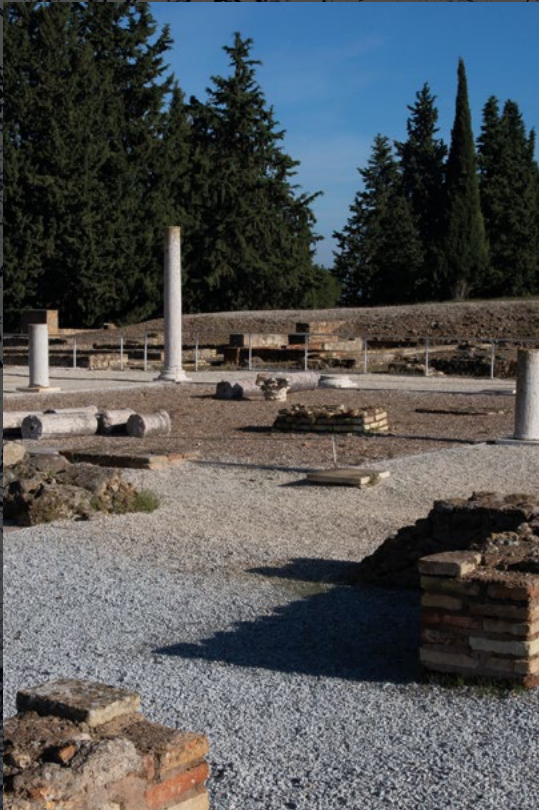
TEATRO ROMANO Su construcción se inicia en tiempos de Augusto, a principios de nuestra era, y fue remodelado en época de Adriano. El edificio está en uso hasta el siglo IV d.C. y, a partir de entonces, se inicia un proceso paulatino de abandono. Su eje mayor mide 98 m y la superficie del pórtico mide casi 2.500 m 2