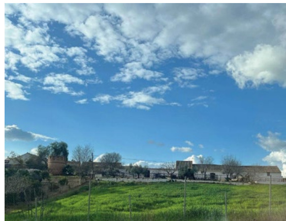
Cortijo de El Bramadero