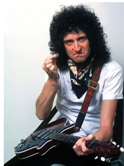
May utilizaba una moneda de seis peniques como púa

El trabajo fue tan excelente que Brian May grabó todos los discos de Queen utilizando su Red Special original y la ha estado tocando en todos los conciertos que la banda ofreció a lo largo de su dilatada carrera sobre los escenarios. Sólo en cuatro ocasiones a lo largo de su trayectoria, eligió usar otras guitarras eléctricas de marcas tradicionales: grabó Crazy Little Thing Called Love , Back Chat y Play the Game con una Fender Tele-