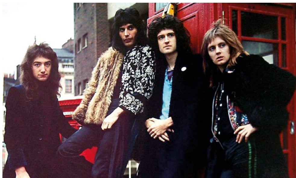
Queen, en sus inicios