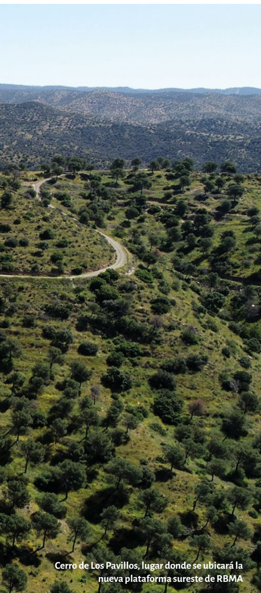
Cerro de Los Pavillos, lugar donde se ubicará la nueva plataforma sureste de RBMA