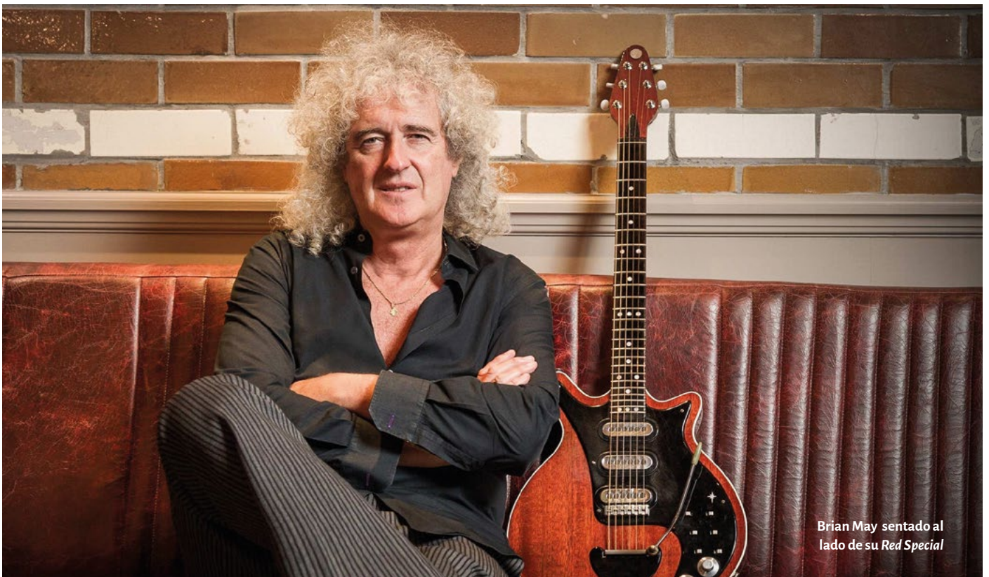
Brian May sentado al lado de su Red Special

Siempre fueron muy populares entre los seguidores del Rock, pero su fama creció muchos enteros entre el público en general después del éxito de Bohemian Rhapsody , el biopic que mostró al mundo la historia de la azarosa vida del frontman de Queen: el colosal Freddie Mercury.