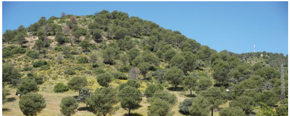
Cerro de Los Pavillos

Para Patricia Gallego, se trata de una gran obra civil, donde “el capítulo de movimiento de tierras tiene especial relevancia debido a la necesidad de realizar importantes excavaciones. Se prevé desmontar hasta 25 metros de profundidad para poder alcanzar la cota de cimentación en el Cerro de los Pavillos, lo que implicará la necesidad de excavar en roca mediante voladura, y haciendo también uso de otros medios más convencionales como el ripado, para retirar un volumen total estimado en más de 1,1 millones de m 3 de tierra.