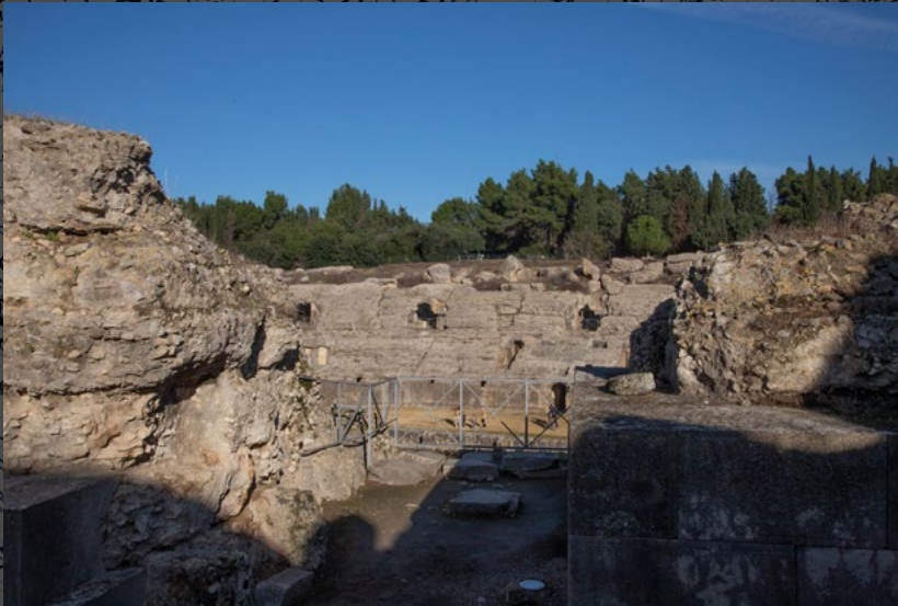
ANFITEATRO ROMANO Su construcción pudo iniciarse en época de Adriano (117-138), cuando se proyecta la ampliación de la colonia italicense en cuyas proximidades se erige. Estuvo en uso hasta el siglo IV. Los ejes del óvalo exterior miden 153 y 132 metros, y los de la arena, 70,6 y 47,3