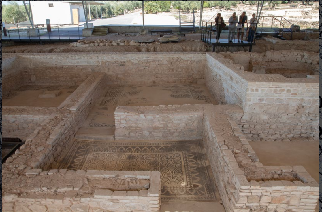
Villa romana. Fuente Álamo, Puente Genil