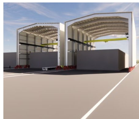
Techado móvil de la nueva plataforma

Tal y como se ha indicado, la plataforma sureste plantea la construcción de 27 nuevas celdas de dos fases: una primera fase en la que se ejecutarán las 12 primeras celdas y otra segunda fase en la que se ejecutarán las 15 restantes, según el ritmo de generación de residuos radiactivos de baja y media actividad.