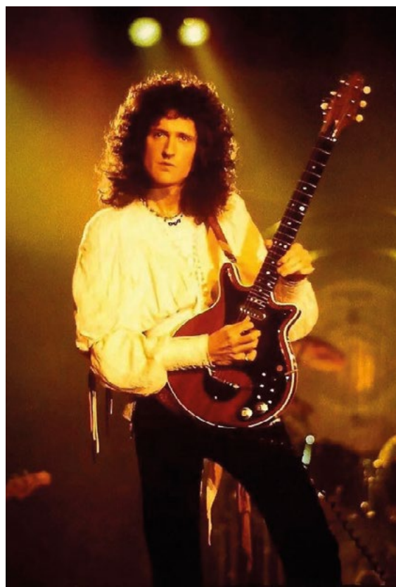
Brian May, en los 70

El caso de Brian May es muy especial ya que él no se limitó a comprar una guitarra y un amplificador y se puso a tocar. El joven Brian, con muy pocas libras en su cartera,