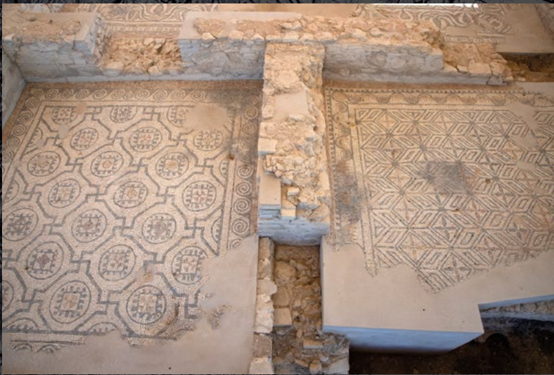
Detalle de los mosaicos. Villa romana. Fuente Álamo, Puente Genil