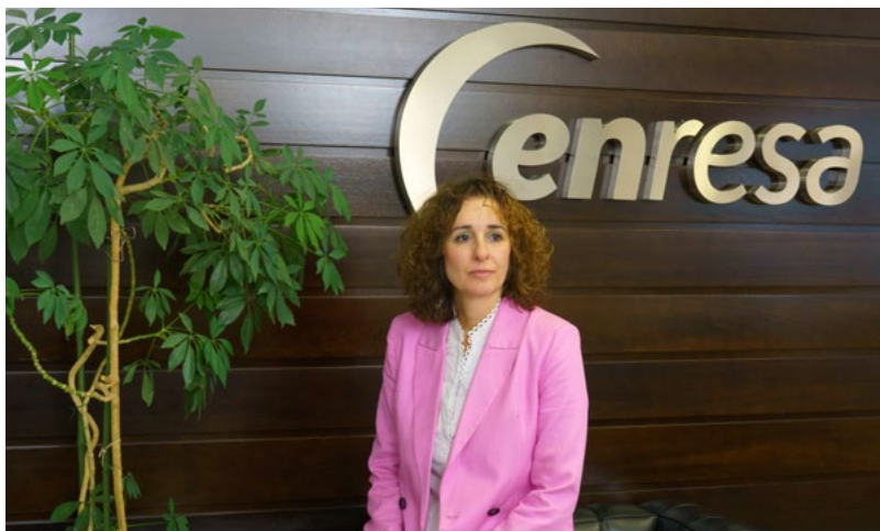
La presidenta, en la sede de Enresa