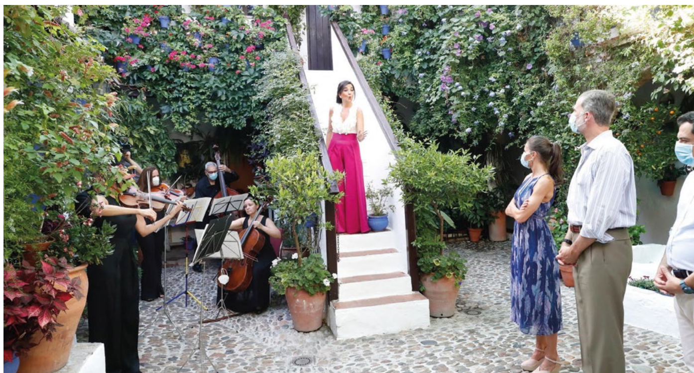
Los Reyes de España, en el patio de San Basilio, 44

El CSC le insiste en su recomendación y le recuerda al Consistorio que el Centro Histórico de Córdoba incluido en la Lista de Patrimonio Mundial de la Unesco no coincide con todo el Conjunto Histórico de Córdoba, “siendo este de mucha más extensión y con distintas características entre sí”.