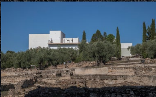
Villa romana, Fuente Álamo. Puente Genil