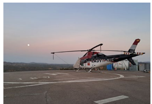
Helipuerto de El Cabril

El personal técnico de Infoca se encargará de impartir formación tanto teórica como práctica en extinción de siniestros forestales a todos los trabajadores de Enresa con responsabilidades en el área de incendios. Así, la suma del medio