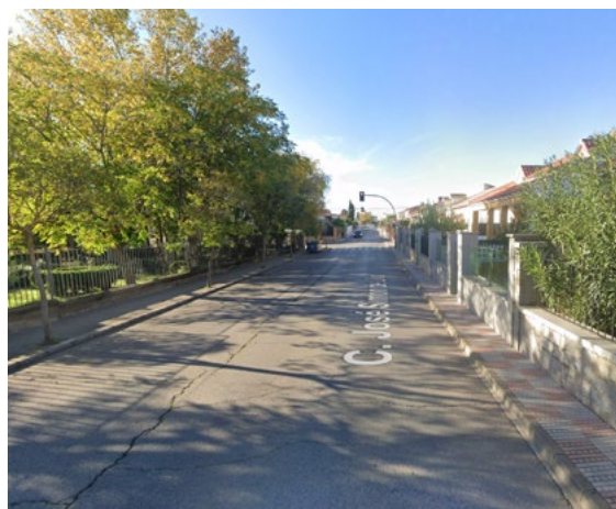
Tramo de la avenida José Simón de Lillo

transformar y modernizar diversos espacios de la localidad para mejorar la accesibilidad y embellecimiento de determinados entornos, es la reforma de un nue-