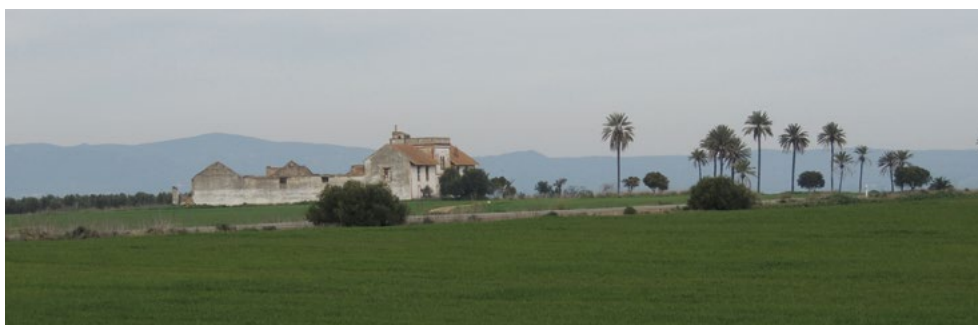
Cortijo Doña Rosa

Debemos destacar que aquellos cortijos dedicados a la crianza de toros de lidia poseían una pequeña plaza de toros para la faena de la tienta, como podemos ver en los cortijos de El Coscojal, La Verduga,