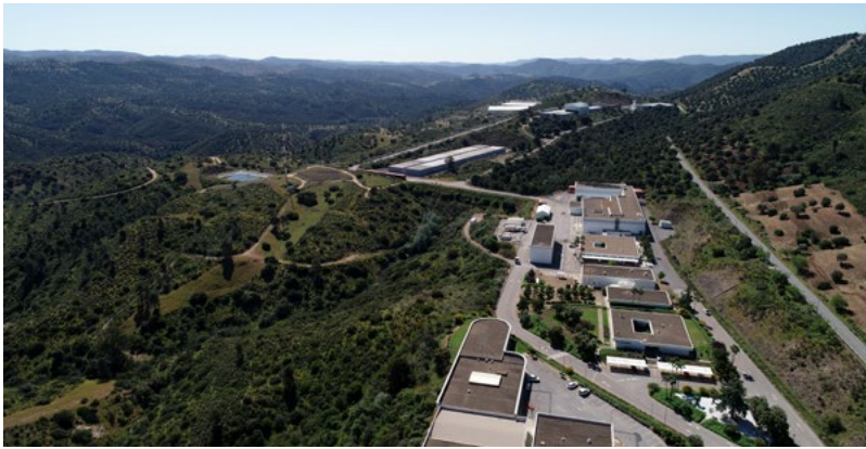
La operación de El Cabril en 2024 transcurrió con normalidad

LA OPERACIÓN DEL CENTRO DE ALMACENAMIENTO DE EL CABRIL se desarrolló con normalidad durante el año 2024. Así, a 31 de diciembre del pasado ejercicio, la instalación recibió un total de 2.722,26 m 3 de residuos radiactivos, de los cuales